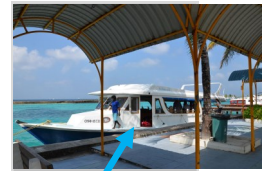
Dohni Anlege „Schmutzli“