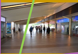
Weg zum Island Aviation Schalter ca. 250 m