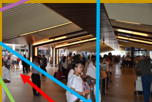
Empfang von Crew in der 2.Reihe