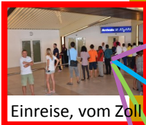
Einreise, vom Zoll